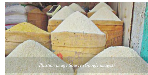
Illustration image

Authorities are also considering waiving the tax on rice imports, said Badrul Hasan, the head of the Directorate General of Food, as local prices have hit a record high and state reserves are at a six-year low. The state buyer issued a tender to import 50,000 tonnes of parboiled rice today, its first such tender in many years, after flash floods hit fields about to be harvested, potentially wiping out 700,000 tonnes of crops. [ Read more ]