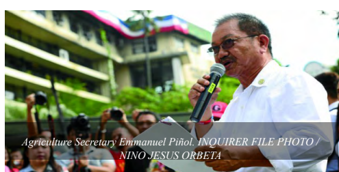
Agriculture Secretary Emmanuel Piñol.

“There are these traders from Bulacan and Binondo who speculate to control prices ... We must stop this rice cartel,” Piñol said, adding that this group was also pushing for his ouster. [ Read more ]