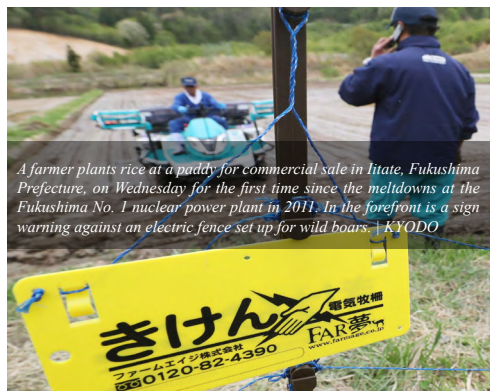
A farmer plants rice at a paddy for commercial sale in Iitate, Fukushima Prefecture, on Wednesday for the first time since the meltdowns at the Fukushima No. 1 nuclear power plant in 2011. In the foreground is a sign warning against an electric fence set up for wild boars.