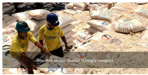
Illustration image

Despite the decline in stocks, the PSA said the total rice inventory during the period is equivalent to the rice-consumption requirement of Filipinos for 79 days. “Stocks in the households would be good for 42 days, those in commercial warehouses for 27 days, and those in depositories of the National Food Authority [NFA] for 10 days,” the PSA said in its monthly report, titled “Rice and Corn Stocks Inventory February 2017”, published on May 11.