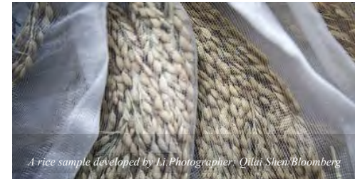
A rice sample developed by Li.

The obesity-linked disease is on a tear in China, and rice -- the country’s favorite staple -- is showing up in studies as an important contributor. The black kernels Li pinches off mature stalks with her fingers and drops into paper sachets have been bred to avoid causing the high spikes in blood-sugar when eaten that can eventually lead to type-2 diabetes. [ Read more ]