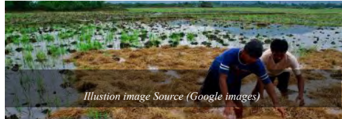
Illustration image