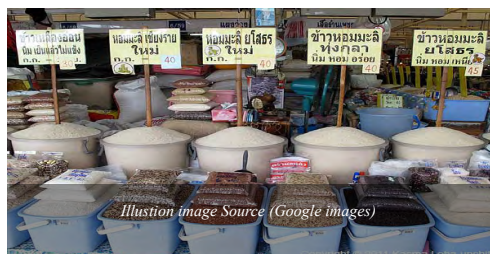
Illustration image

Prices are expected to remain high for the next one to three weeks, traders said. [ Read more ]