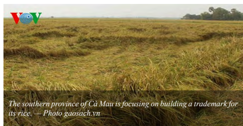
The southern province of Cà Mau is focusing on building a trademark for its rice.

The province is also prioritising connecting with enterprises to popularise Cà Mau’s specialty rice products at agents, shops and supermarkets inside and outside the province. [ Read more ]