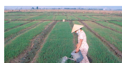
A farmer waters her rice field in Hà Tĩnh Province’s Hồng Lĩnh Town.

Đức Thọ District is believed to suffer the most from the disease with 1,968ha of affected crop, the department said. Of which, about 300ha of crop were completely damaged in the communes of Đức Lạc, Đức Hòa, [ Read more ]