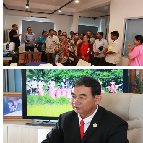
Learn more ອິດ ອີຣຸສາ ຫວອ ຒ